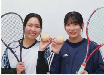
女子ソフトテニス