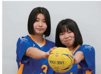
女子ハンドボール