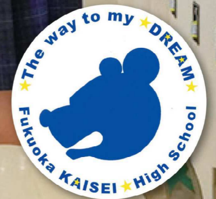
マスコットキャラクター「北斗くん」