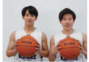
男子バスケットボール