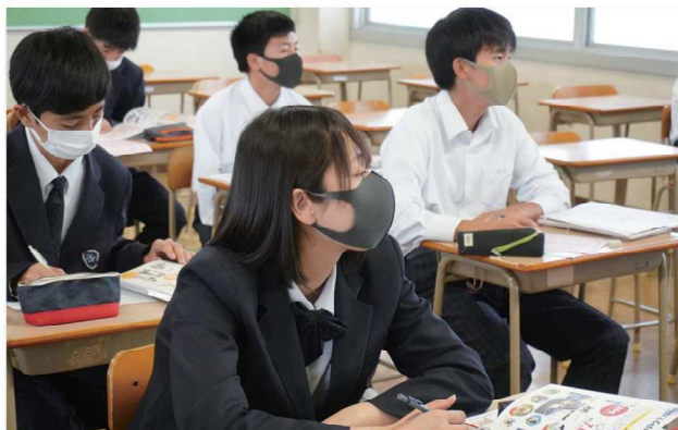
職業理解ガイダンス（1年次）