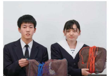
エコロジー研究会