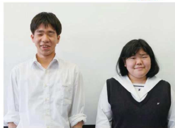
キャリアアップ研究会