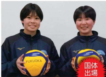
女子バレーボール(強化部)