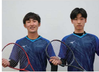
男子ソフトテニス