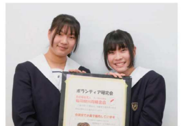
ボランティア研究会