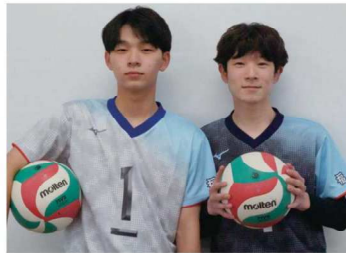
男子バレーボール